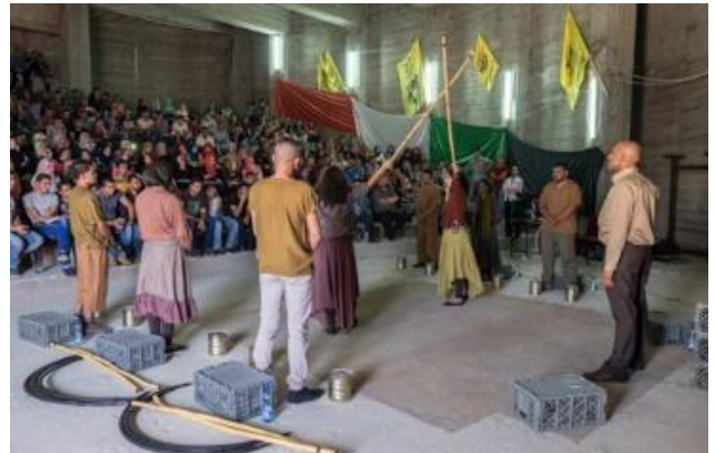
Ashtar Theatre, "La Cour - vallée du Jourdain" à l'Open Université de Naplouse 19 septembre 2015

Presque tous les théâtres, quelle que soit leur taille ou leurs ressources, font un travail important avec les jeunes. C'est à la fois un devoir pour lutter contre les forces de violence résultant de l'occupation israélienne et une source non-négligeable de financement par les ONGs.