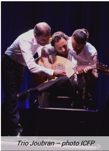
Trio Joubran

« Palest'In & Out » célèbre à Paris la scène émergente palestinienne. De jeunes artistes de moins de 35 ans sont sélectionnés par leurs pairs et par des responsables de structures culturelles et de festivals innovants, sur la base de critères professionnels exigeants.